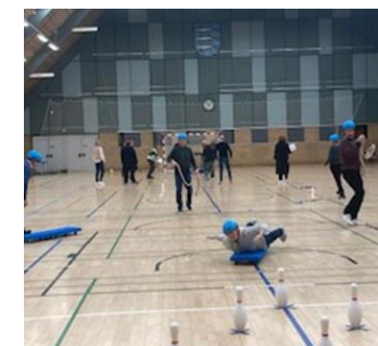
SJOV I HAL